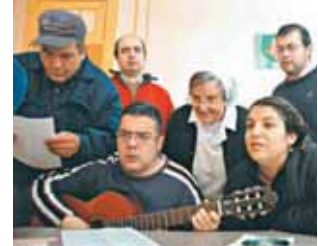
Hay que derribar mitos frente a las enfermedades mentales.

Añade que tanto las 7 religiosas de los centros que hoy tienen, como el personal que trabaja con ellas, hacen sentir a sus pacientes "que son personas