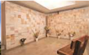
Memorial Parroquial, Nuestra Señora de Fátima, Independencia