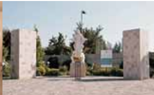
Memorial Parroquial Inmaculado Corazón de María, Maipú