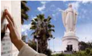
Memorial Madre de Santiago, Cerro San Cristóbal

MÁS DE 40 LUGARES DE ENCUENTRO MÁS CERCA Y PARA SIEMPRE