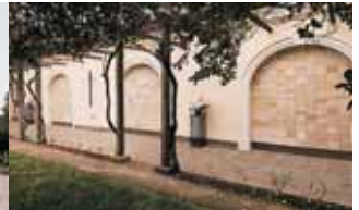
Memorial Parroquial Nuestra Señora de la Divina Providencia