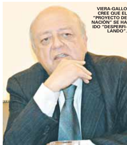
VIERA-GALLO CREE QUE EL "PROYECTO DE NACIÓN" SE HA IDO "DESPERFI-LANDO".

Existen en Chile múltiples instancias de comunicación y de encuentro. No hablaría de que el país o la sociedad chilena esté bloqueada o profundamente fracturada. Sin embargo, hay muchos síntomas que nos deben llamar a meditar. Existe la violencia juvenil y la delincuencia, que son formas de expresar una necesidad de diálogo interrumpida. Creo que el diálogo es una virtud y una pedagogía, que está muy bien