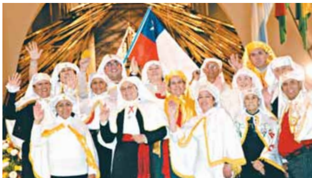
Grupo de cuasimodistas que estarán junto al Papa Benedicto XVI en Aparecida.